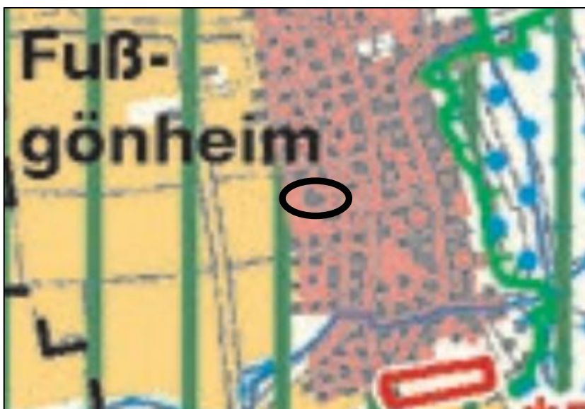
Ausschnitt aus der 1. Änderung des Einheitlichen Regionalplan Rhein-Neckar, Stand März 2023

Der Entwurf zur 1. Änderung des Einheitlichen Regionalplans in der Fassung zur 2. Offenlage vom März 2023 weist die Fläche ebenfalls als Siedlungsfläche Wohnen aus. Eine Veränderung zeigt sich lediglich südlich angrenzend an das Plangebiet. Hier wird eine kleine, vormalige „Weißfläche“ durch eine Siedlungsfläche Wohnen im Bestand ersetzt. Dies ist auf die zwischenzeitlich erfolgte Bebauung der Fläche mit Wohnhäusern zurückzuführen.