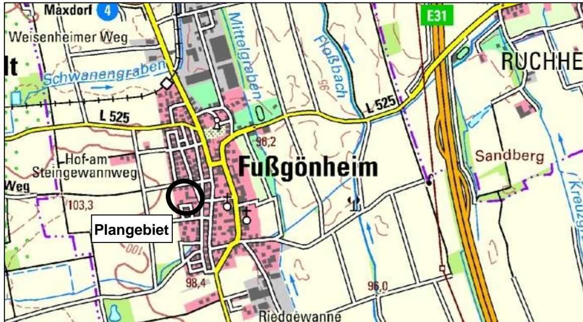
Lage des Plangebiets

Das Plangebiet hat eine Größe von ca. 1,5 ha und befindet sich am westlichen Rand der Ortslage von Fußgönheim. Es umfasst das Gelände der Schillerschule sowie der Luther-Kindertagesstätte. Im Norden, Osten und Süden schließen Wohngebäude an. In Richtung Westen folgt die freie Landschaft.