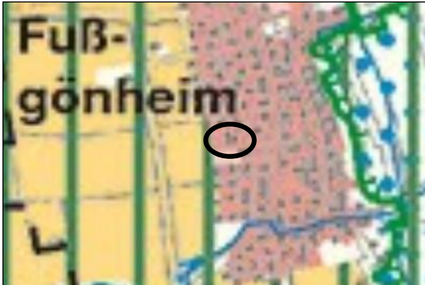
Ausschnitt aus dem Einheitlichen Regionalplan Rhein-Neckar

Der im September 2014 genehmigte Einheitliche Regionalplan Rhein-Neckar 2020 weist das Plangebiet als Siedlungsfläche Wohnen im Bestand aus.