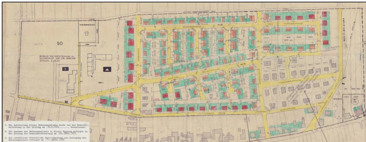
Planzeichnung des Bebauungsplans „Änderung 2 zum Teil Bebauungsplan In der Ersten, der Zweiten unteren Langgewanne“ aus dem Jahr 1973.